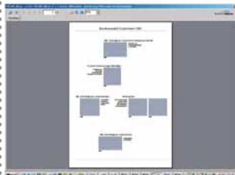
Aus MICHELalbum Version 1.1