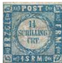
MINr. 5 Type I: magere Randinschriften mit Abkürzungspunkten, beide „I“ in SCHILLING“ mit I-Punkten