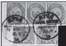
Senkrechter Dreistreifen der 2 Mk. M.Nr. 37 e mit Paar der 10 Pfg. braunrotrot, M.Nr. 47 c, 20. 6. 94