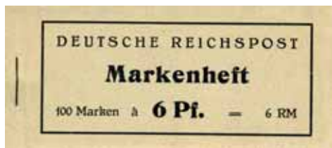
MH A 1 Vorderseite (2. bis 4. Deckelseite unbedruckt)

Mitteilungsblatt des Landesverbands Hessen