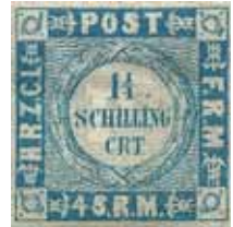
MINr. 5 Type II: wie Type I, jedoch etwas stärkere Randinschriften, weit gewellter Grund