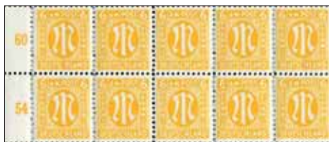
H-Blatt A 1